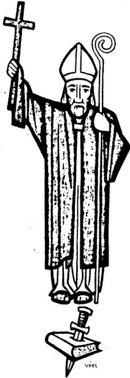
SANKT BONIFATIUS (+754)