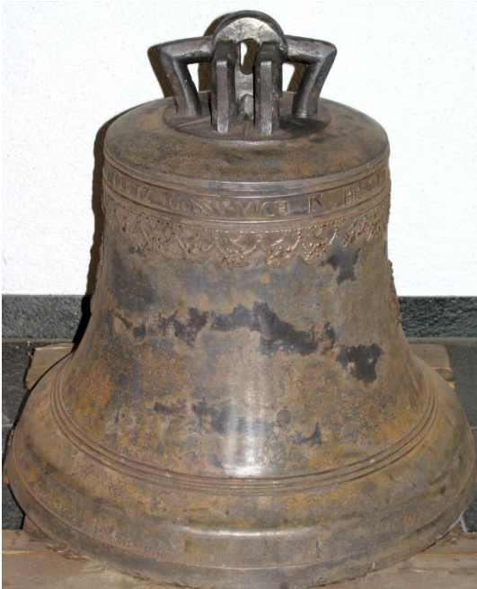
MARIEN- UND FRIEDENSGLOCKE Sebastian und Sigmund Goetz - Breslau 1711