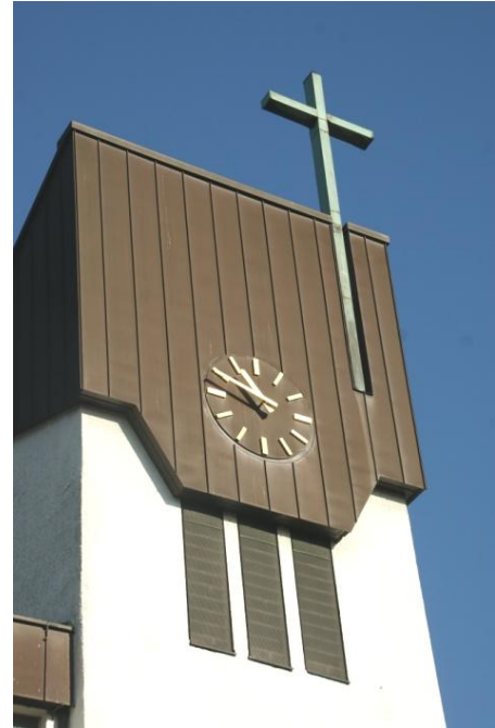
Kath. Kirche ST. BONIFATIUS Asperg