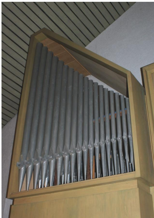
ORGEL • fa. Walcker 1965