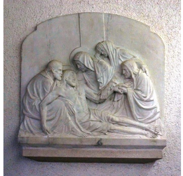
PIETÁ • Stiftung 1954